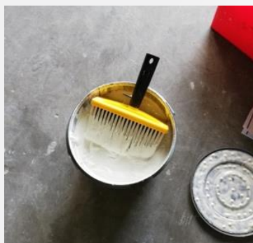
Aanbrengen van EZY-NET® met blokkwast of airless

EZY-NET® is een pasteuze vloeistof die wordt aangebracht met blokkwast of airless, en die tijdens de drogingsfase roet and andere vervuilingen absorbeert; na enkele dagen wordt EZY-NET® van de ondergrond gehaald als een folie.