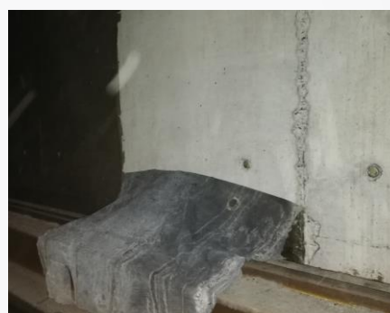
Verwijderen van EZY-NET®-folie.